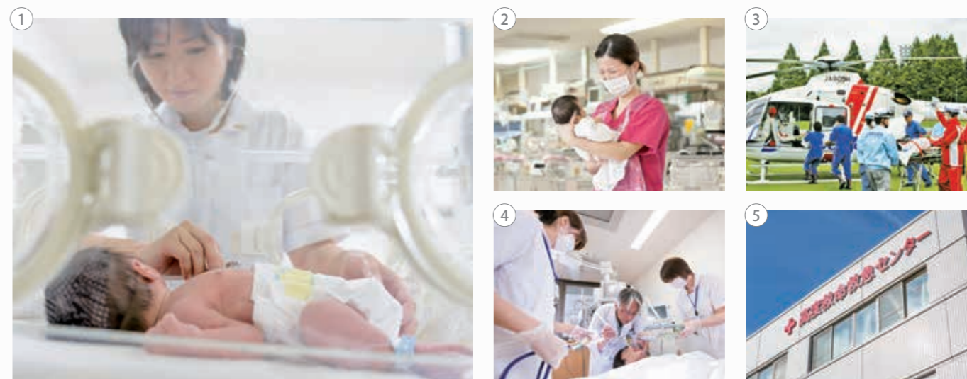
①②周産期医療／③ドクターヘリ／④ICU／⑤高度救命救急センター

また、大津地域の小児救急医療支援事業の拠点病院として、医師会ならびに大学病院の小児科医と協力して、24時間、365日、安心して小児科診療が受けられる体制を整備しています。