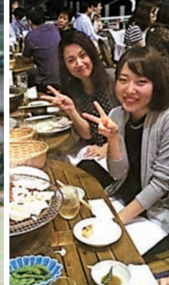
親睦会 (職員互助会制度)