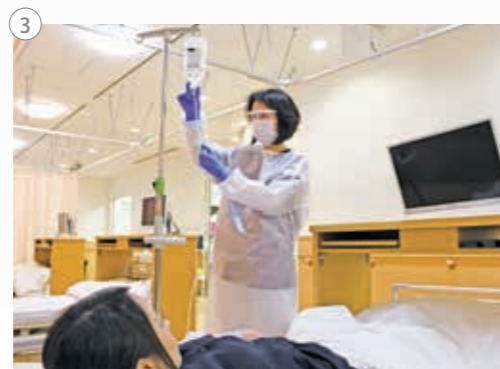
①手術支援ロボット（ダヴィンチ Xi）／②トモセラピー（高精度放射線治療装置）／③化学療法（通院治療センター）