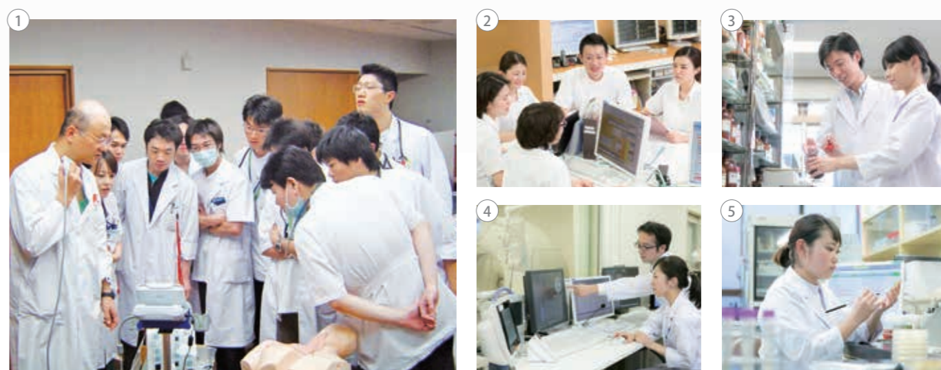
①臨床研修／②病棟カンファレンス／③薬剤師／④診療放射線技師／⑤臨床検査技師

専門職として各部門ごとに 個々の能力開発ができるように 教育支援を行っています。