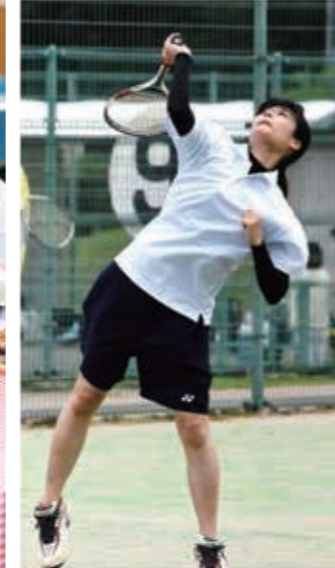
スポーツクラブ活動