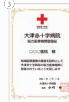
①市民のためのがん講座／②赤十字県民大学／③協力医療機関登録制度