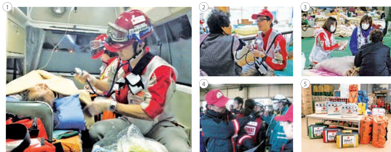
①～③医療救護活動／④DMAT 活動／⑤救護用資機材