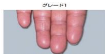
皮膚の紅斑と知覚過敏はあるが、無痛性

手や足の皮膚が障害されることで起こる副作用です。 放置すると、以下の写真のようにグレード1から3まで症状が悪化します。