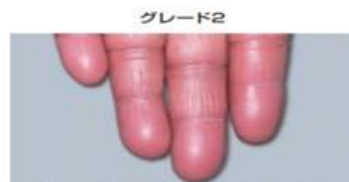
腫脹を伴った紅斑で疼痛を伴うが日常生活に問題なし