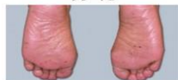
腫脹を伴った紅斑で疼痛を伴うが歩行に問題なし