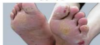
亀裂、潰瘍等による強い痛みで歩行困難となる