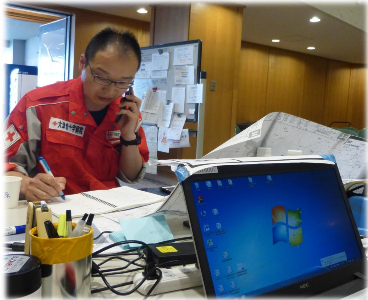
活動中の救護班からの情報収集