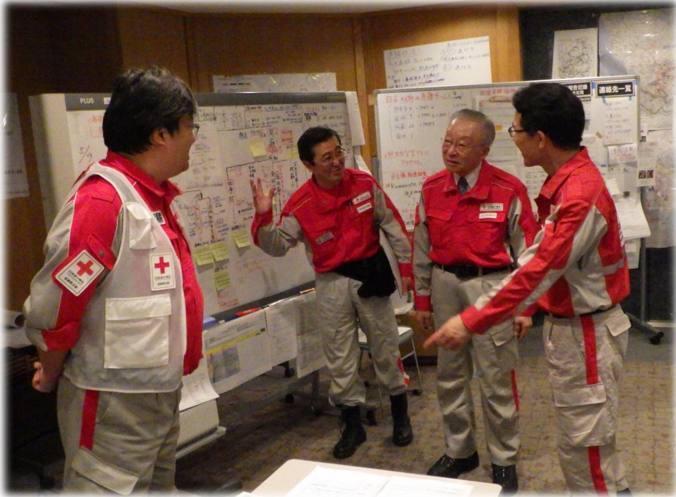
日本赤十字社北海道支部長の表敬訪問