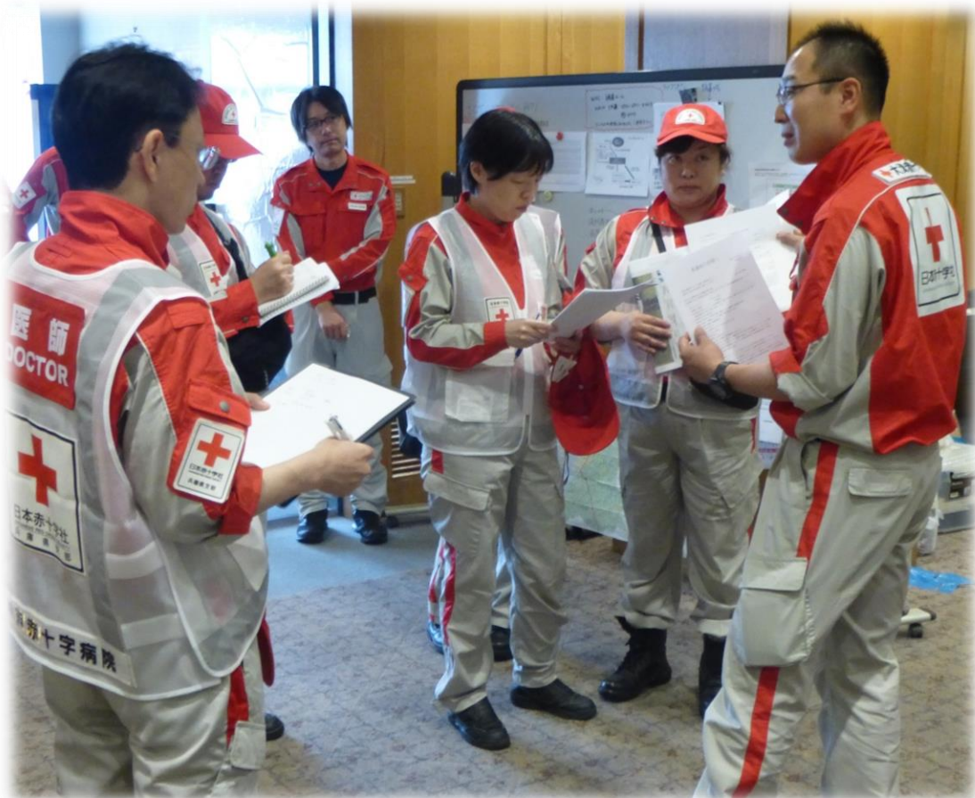
到着救護班に活動中の注意事項を伝達