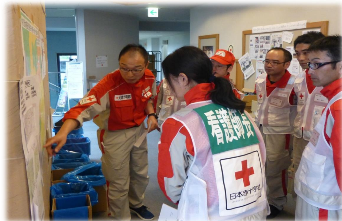
活動地域までの道路状況を説明