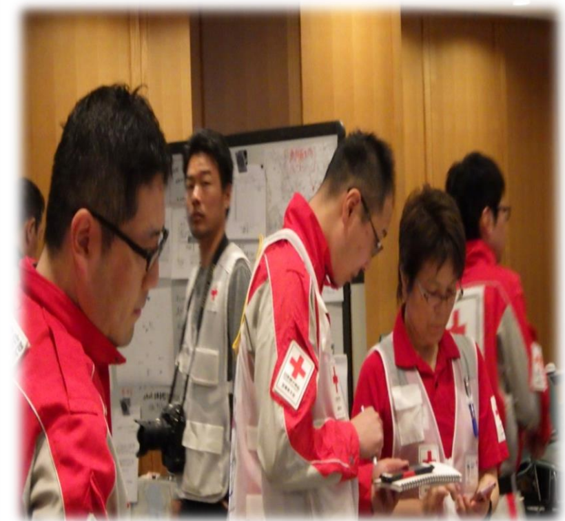
災害コーディネータスタッフ打合せ