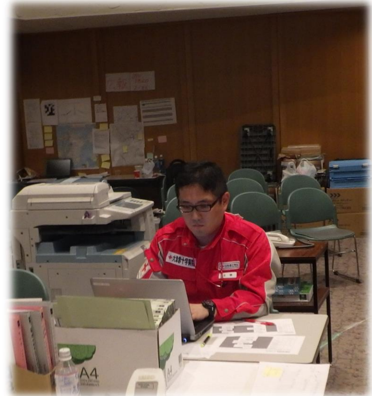
全体ミーティング後の活動集計業務