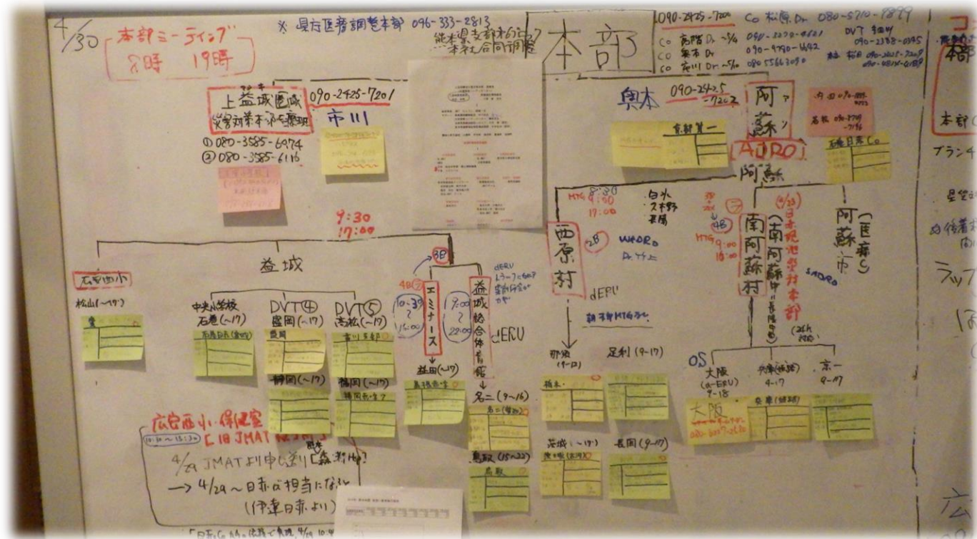
災害対策本部の状況図