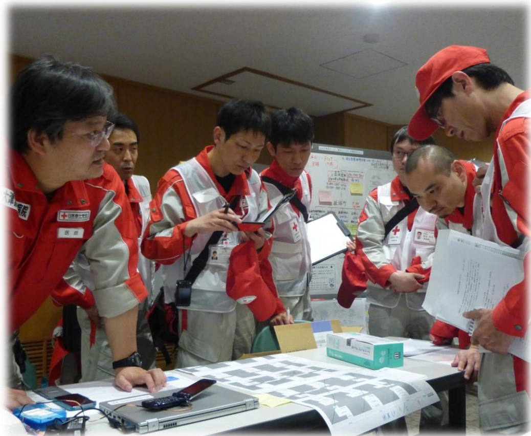
各救護班に活動場所を伝達