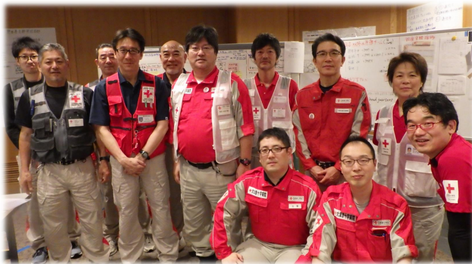
9日間の活動を終えて..