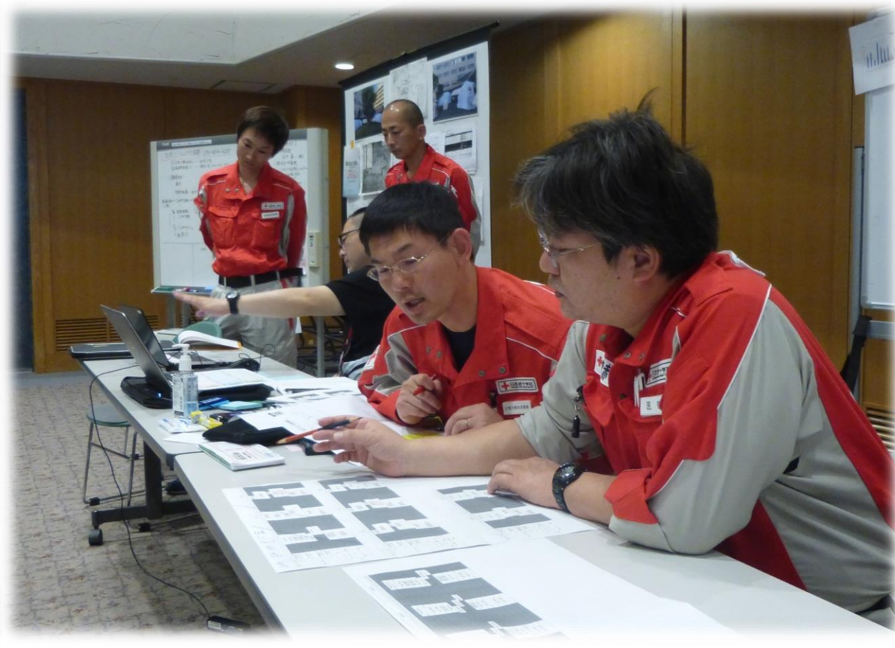
本社職員との救護班派遣調整