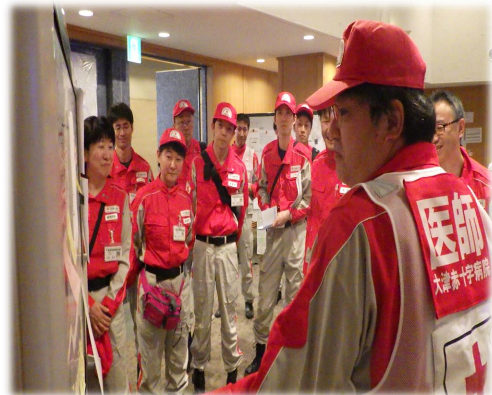
到着救護班への報告・指令