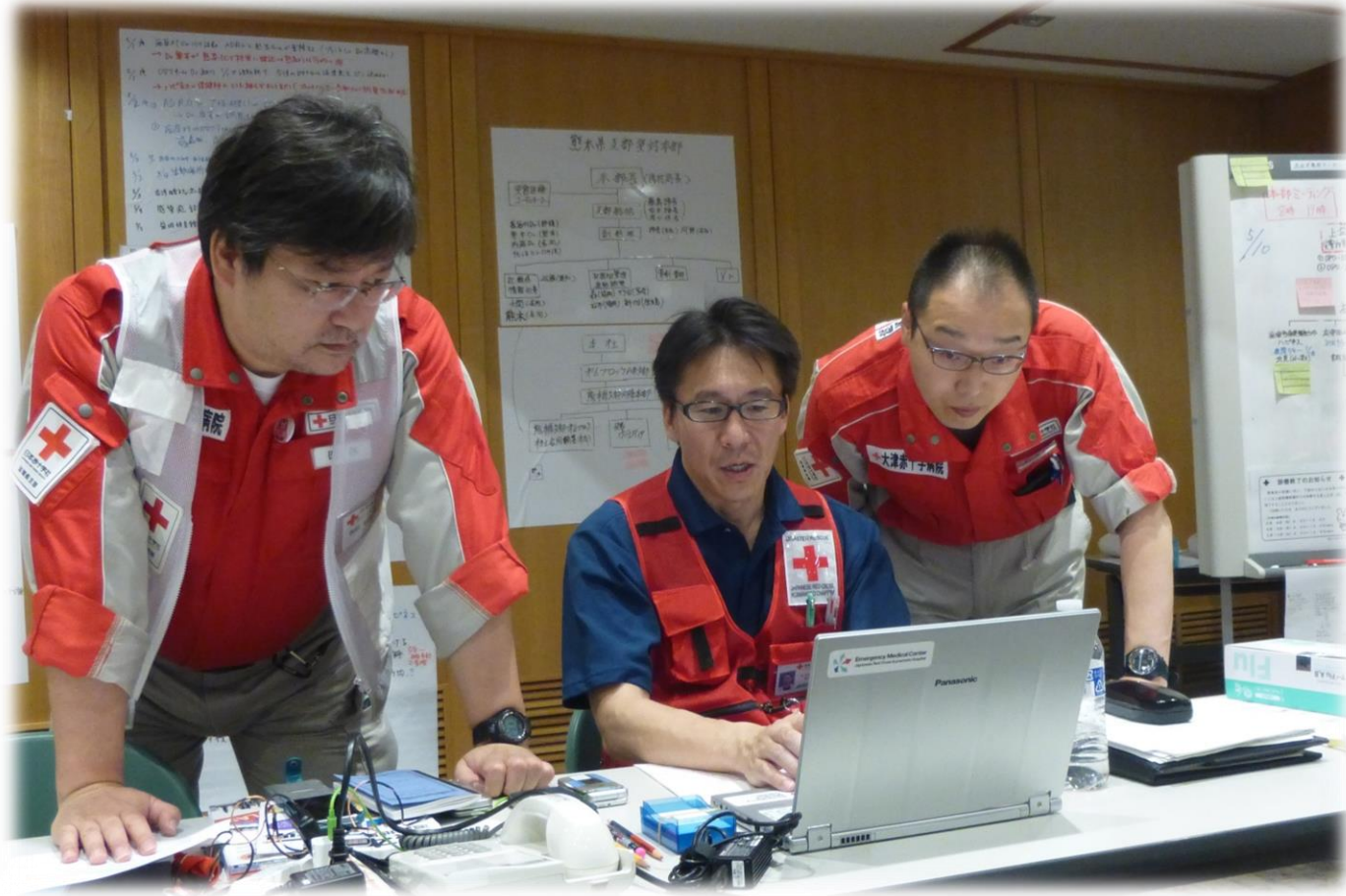
南阿蘇地域担当コーディネーターからの現状報告