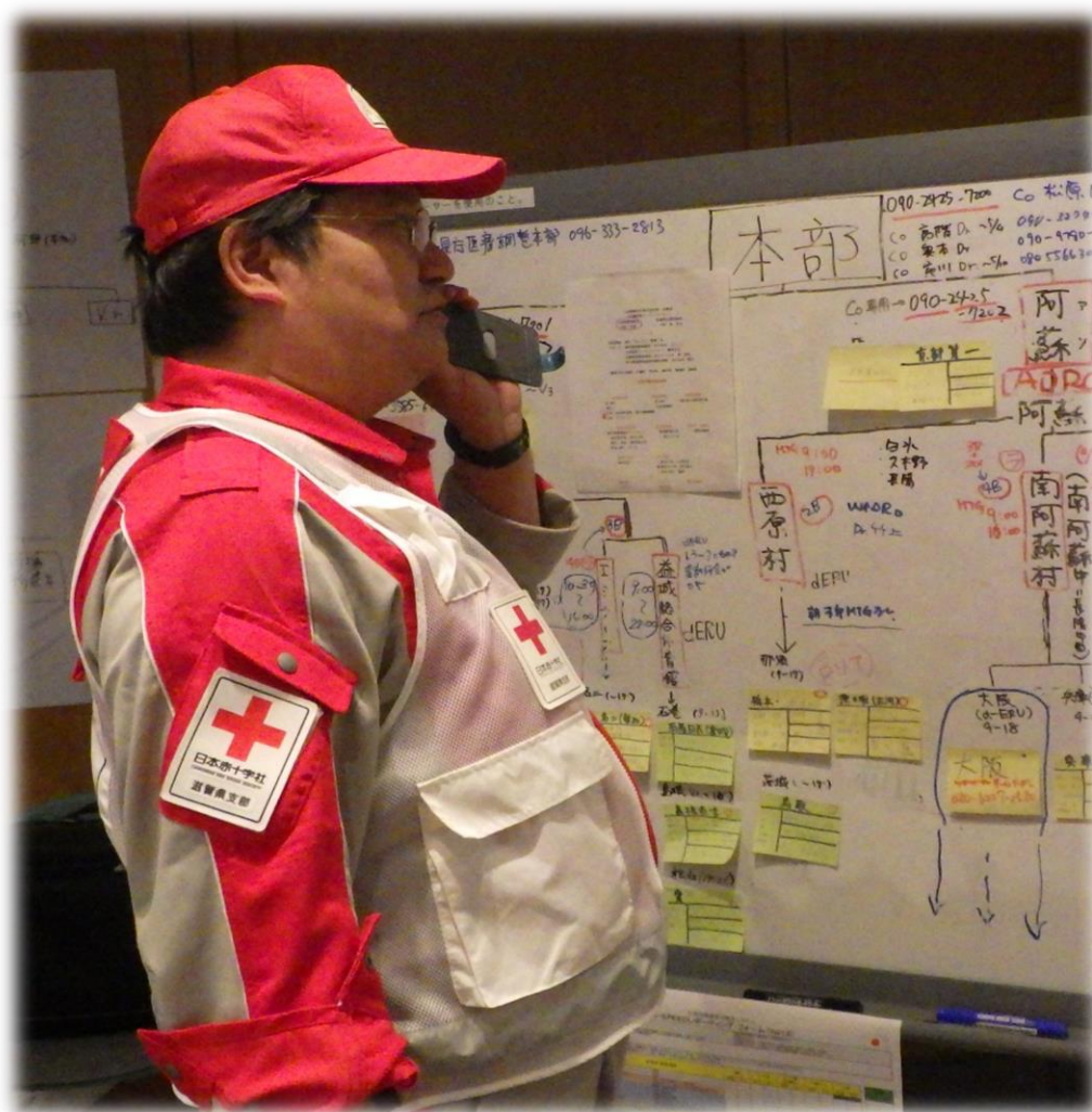
各活動団体との連絡調整