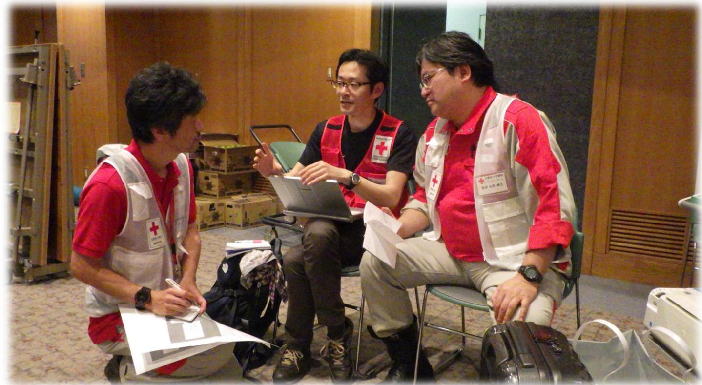
「深部静脈血栓症」対策チームとの打合せ