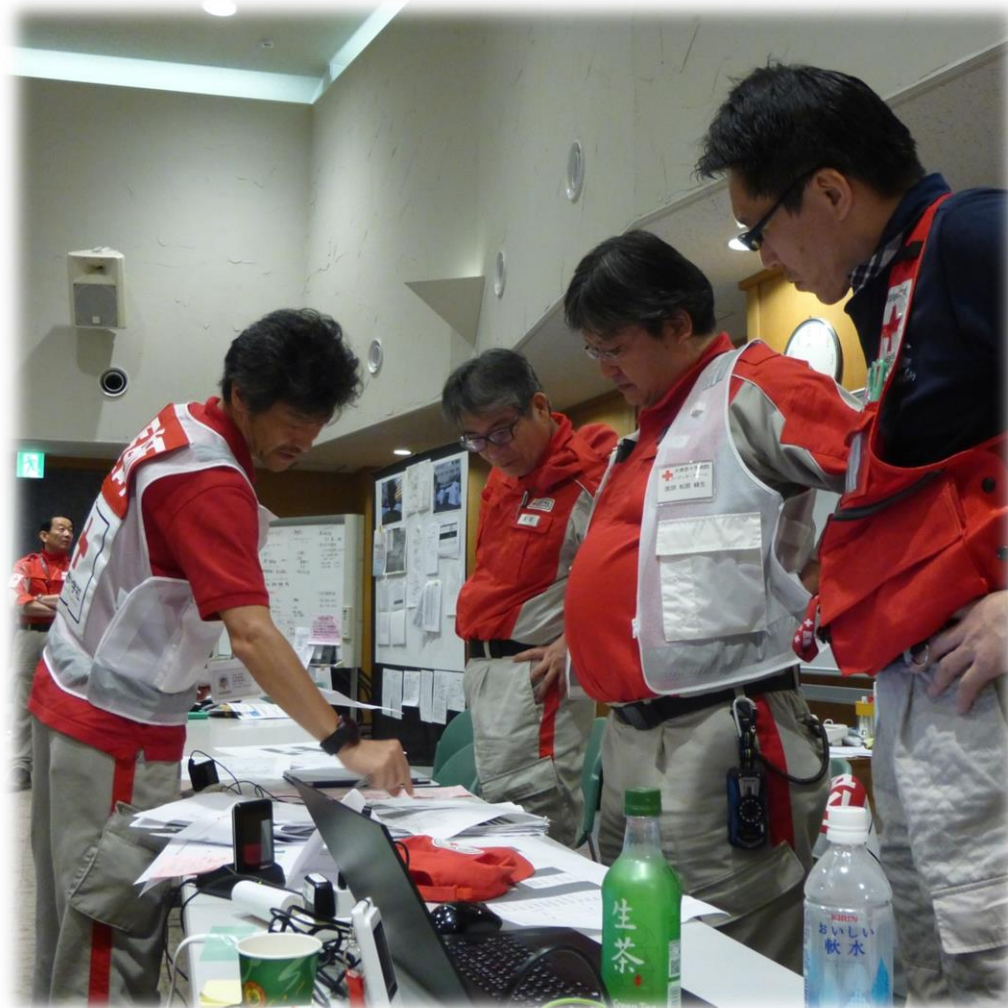
医療コーディネーターミーティング