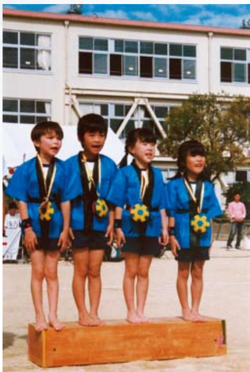
「メダリスト達」(院内保育所運動会より)

滋賀県がん診療広域中核拠点病院・地域がん診療連携拠点病院 高度救命救急センター・基幹災害拠点病院 総合周産期母子医療センター・地域医療支援病院 滋賀県肝疾患診療連携拠点病院・滋賀県難病医療拠点病院 滋賀県エイズ診療拠点病院