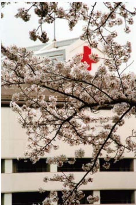
【桜花繚乱】

滋賀県がん診療広域中核拠点病院・地域がん診療連携拠点病院 高度救命救急センター・基幹災害拠点病院 総合周産期母子医療センター・地域医療支援病院 滋賀県肝疾患診療連携拠点病院・滋賀県難病医療拠点病院 滋賀県エイズ診療拠点病院